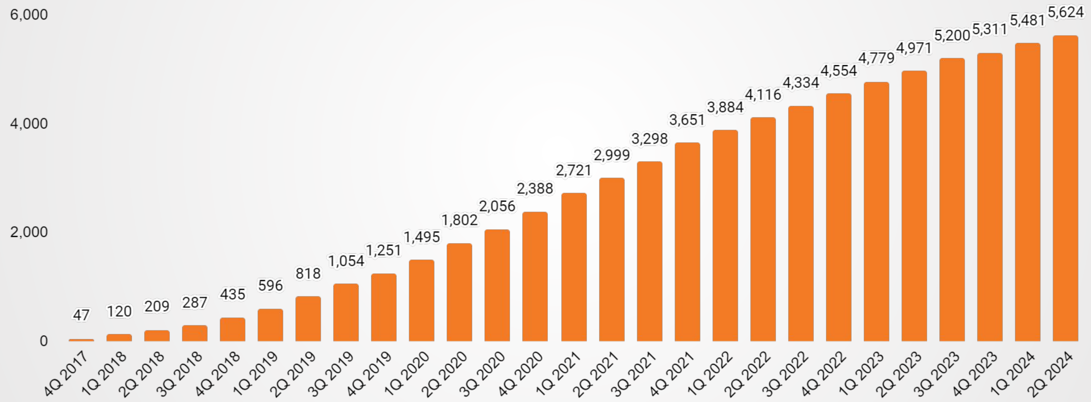
Przyrost liczby użytkowników platformy [w tys.]